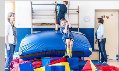
Angebote für Kinder