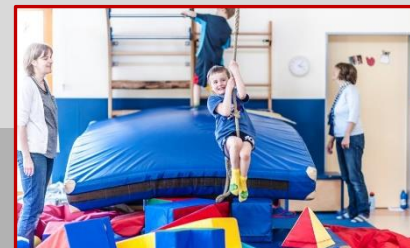
Angebote für Kinder