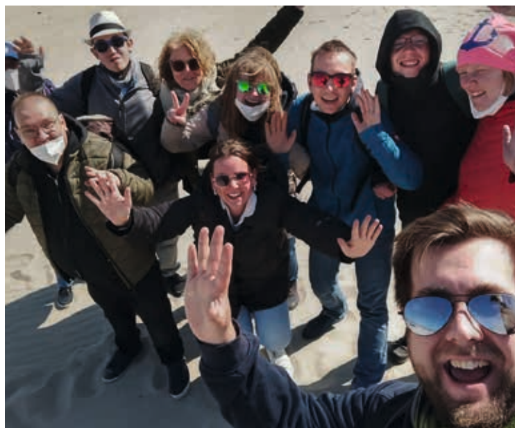
Spaß auf Norderney