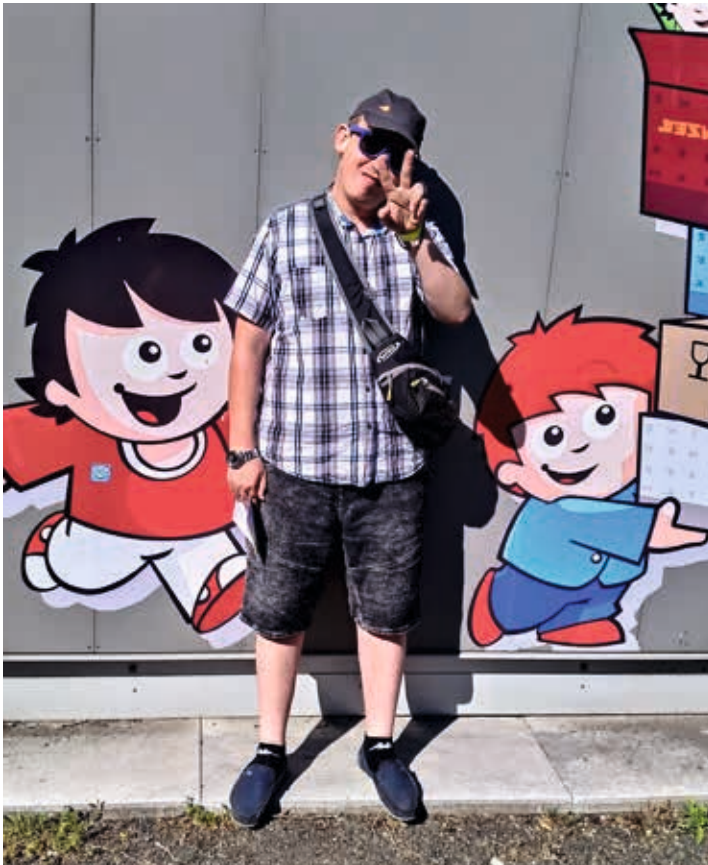
Besuch des ZDF-Fernsehgarten