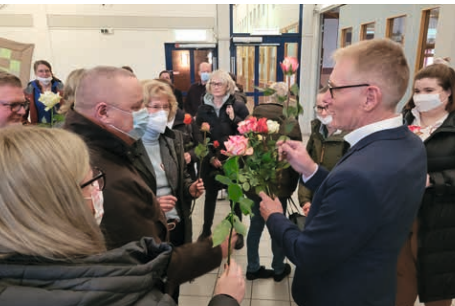
Die Mitarbeitenden des Zweigwerks Steinfurt standen am Ausgang Spalier und überreichten ihrem scheidenden Leiter Rosen.