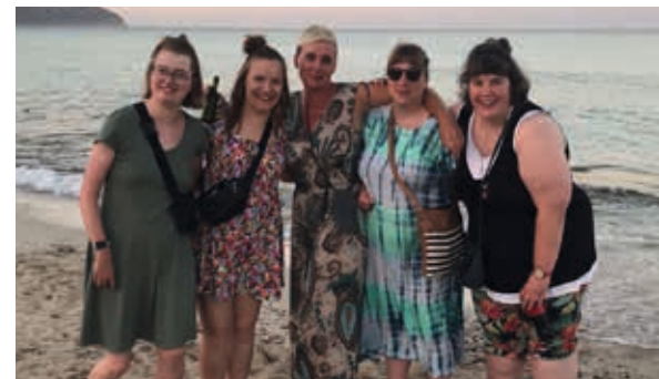
Abends am Strand

Glücklicherweise wurden wir in Hamburg von einigen Eltern mit Autos und leckeren Proviant-Paketen abgeholt, so dass wir gegen 1.00 Uhr müde und wohlbehalten zuhause ankamen. Trotz des Flugausfalls war es am Ende wieder eine tolle Reise!