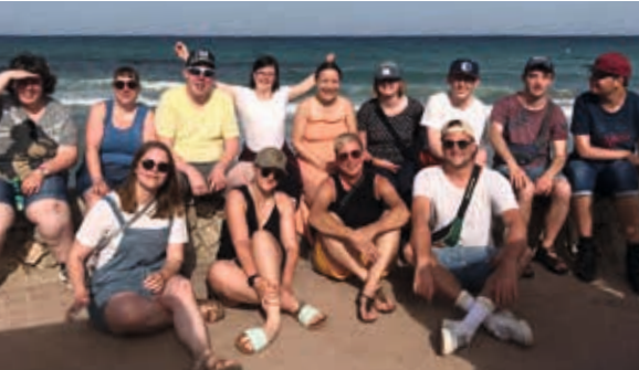
Erster Tag auf Mallorca

Am Freitag (17. Juni) traf sich unsere Reisegruppe – neun Teilnehmende und vier Assistentinnen und Assistenten – um Mitternacht am Flughafen Münster/Osnabrück. Wir waren alle ein bisschen müde, aber auch voller Vorfreude, denn jetzt ging es ab in den Urlaub. Um 3.40 Uhr startete der Flieger und wir landeten um 6.00 Uhr glücklich auf Mallorca.