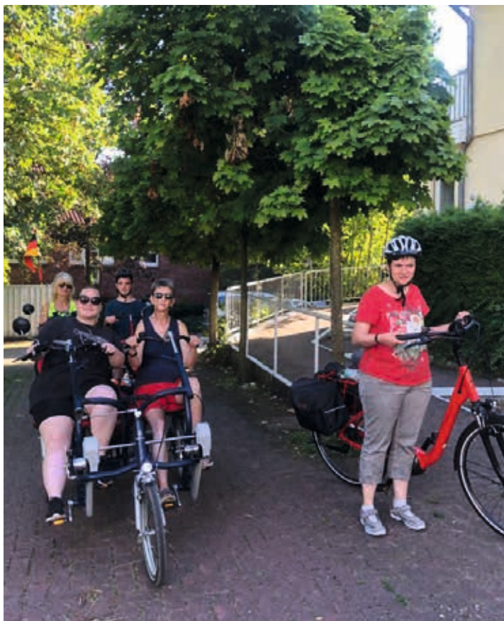
Fahrradtour nach Rheine