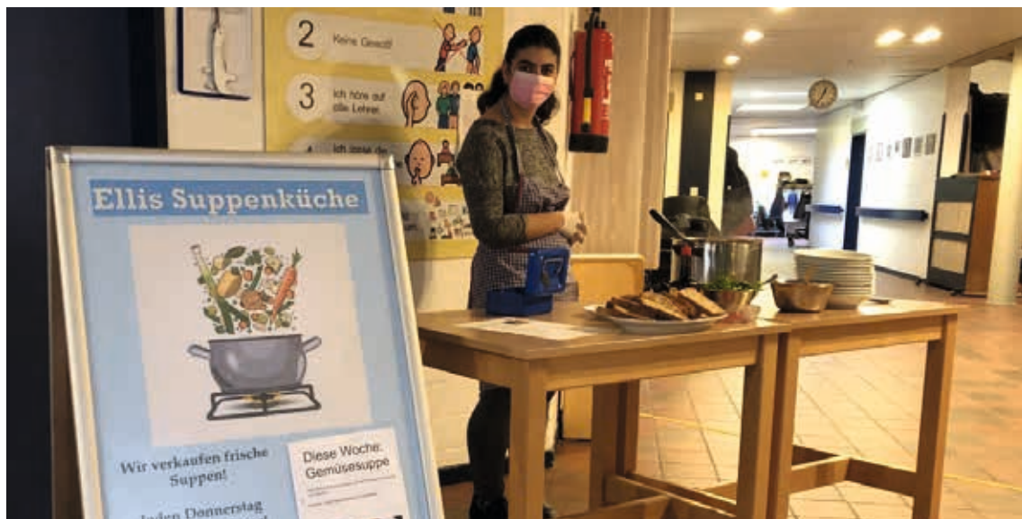
Alles steht für den Verkauf bereit. Um 12.30 Uhr geht es los.

Uns macht diese Aufgabe viel Spaß. Wir teilen uns die zu erledigenden Aufgaben ein und haben gelernt: Wenn jeder seine Fähigkeiten einsetzt, können wir gemeinsam viel erreichen. Das Projekt wird unsere Schule noch eine Weile begleiten, bevor wir uns neuen Aufgaben zuwenden. Vielleicht heißt es dann bald: Willkommen in „Ellis Tortenmanufaktur“ – Was können wir Ihnen Gutes tun?