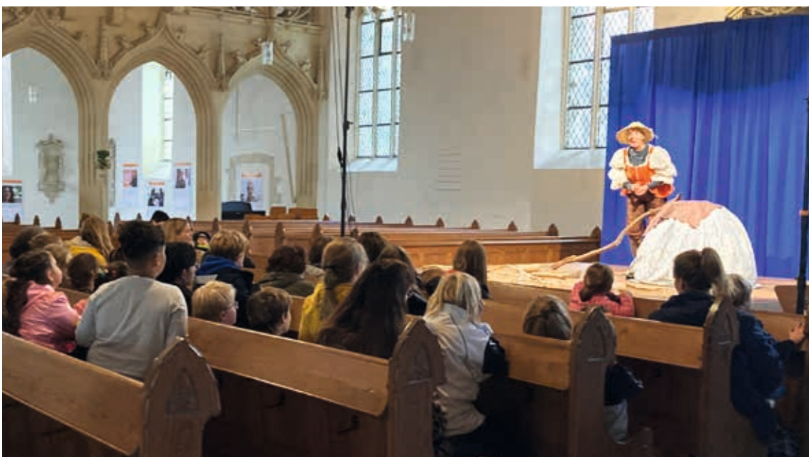
Die Schülerinnen und Schüler schauen gespannt zur Bühne.

Dieses spannende Märchen konnten sich die jüngeren Schülerinnen und Schüler als Theaterstück in der evangelischen Großen Kirche in Burgsteinfurt anschauen. Die Künstlerin „Pina Luftikus“ spielte alle Personen in der Handlung nach. Sie trug einen riesigen Rock, aus dem sie viele Dinge herbei zaubern konnte. Die Schülerinnen und Schüler waren begeistert von dem Theaterstück, durften sie sich doch beteiligen, indem sie gesungen, geklatscht und das Summen von Bienen nachgeahmt haben. Eine Schülerin durfte sogar mit auf die Bühne kommen.