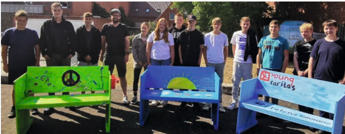
Die Firmbewerberinnen und -bewerber aus Ochtrup mit den von ihnen gebauten Bänken

In Kooperation mit der Pfarrei St. Lambertus in Ochtrup sind im Rahmen der Firmvorbereitung drei Bänke gebaut und gestaltet worden. Eine vielfältig-bunte Bank mit Peace-Zeichen steht seitdem auf der „Gemüse-Ackerdemie“ der Marienschule in Ochtrup. Eine Bank mit der Aufschrift „youngcaritas“ und „#PlatzFürToleranz“ steht vor dem Kardinal-von-Galen-Haus und eine weitere Bank wird demnächst am neuen Pfarrhaus stehen. Auf dieser sind unter anderem weiße, schwarze und auch bunte Handabdrücke zu sehen. Außerdem schmücken Friedenstauben die Seitenteile.