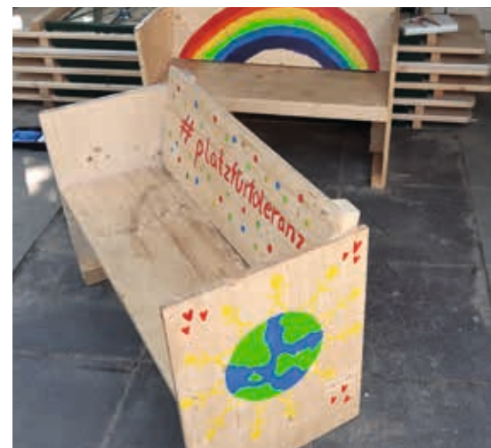
Die Kinderbänke am Caritaskindergarten Morgenstern

Im vergangenen Sommer haben sich auch die Auszubildenden der Kreissparkasse Steinfurt an der Aktion beteiligt und gemeinsam mit der youngcaritas Steinfurt ein Novum gewagt: Die zwei Bänke, die nun am Caritaskindergarten Morgenstern in Steinfurt stehen, sind die ersten beiden Bänke für Kinder, die im Rahmen der Aktion entstanden sind. Alle Maße der originalen Bauanleitung sind dabei mit dem Faktor 0,7 multipliziert worden. Auch diese Bänke zeigen neben dem Namen der Aktion unter anderem die Weltkugel und einen Regenbogen. Zusätzlich zum handfesten Zeichen des Bankbaus für Toleranz haben die Auszubildenden 700 Euro an Spenden gesammelt und wenig später dem Caritasverband übergeben.