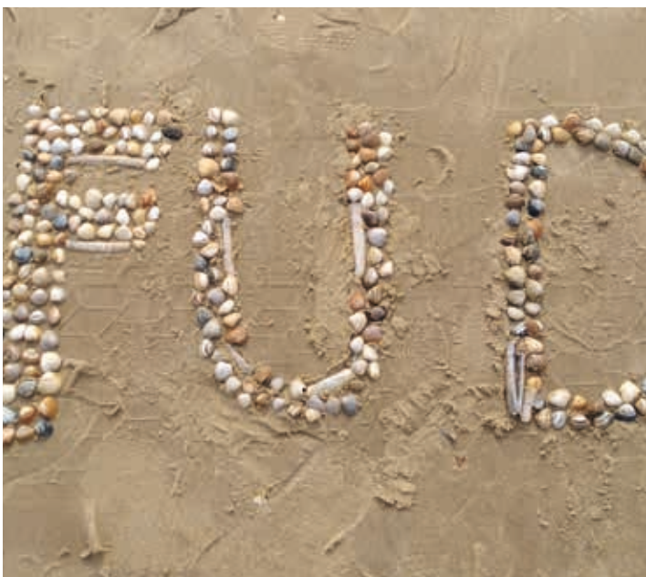
Reise nach Katwijk