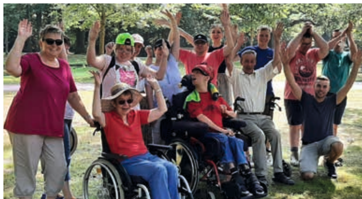
Urlaub ohne Koffer