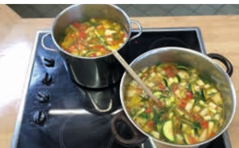
... wird eine leckere Suppe zubereitet.

Natürlich gehört auch der Aufbau des Verkaufsstandes dazu. Geschirr und Besteck müssen abgezählt und bereitgestellt werden. Untersetzer für die heißen Töpfe und Suppenkellen dürfen auch nicht fehlen. Und dann noch: Anmeldeliste und Stift bereitlegen, Wechselgeld in der Geldkasse prüfen und bereitstellen, Suppen-Toppings anrichten und die Suppen und Beilagen bereitstellen. Um Punkt 12.30 Uhr muss die Suppe fertig sein und der Verkauf der Speisen startet. Auf Wunsch liefern wir die Suppen auch in die Klassen. Am Ende des Tages heißt es dann: Abräumen, aufräumen, abwaschen, abrechnen.