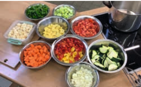
Aus frischen Zutaten ...