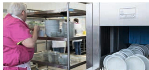
... Silke Nienkötter arbeiten an der Spülstraße, in der die Teller, das Besteck, die Tablettts etc. gesäubert werden.